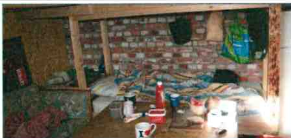
boforhold: Da Arbeidstilsynet var på Lekerøya, dokumenterte de med bilder at arbeiderne sov og spiste på samme rom, og at fire køyer per rom var i bruk.