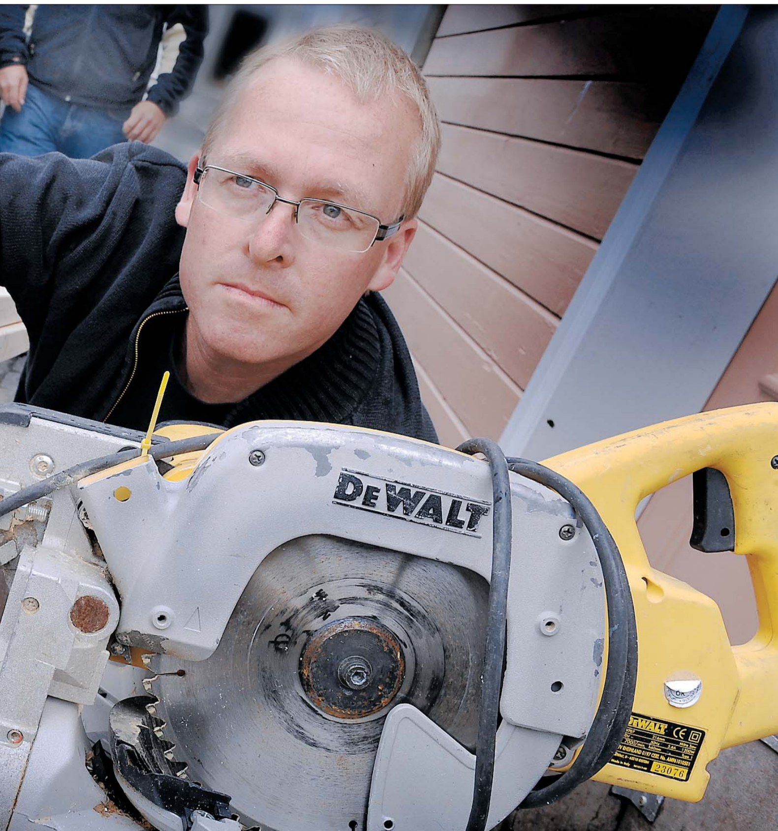
smuglet hjem av norske arbeidsgivere.